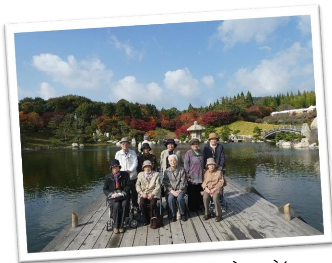
外出レクリエーション