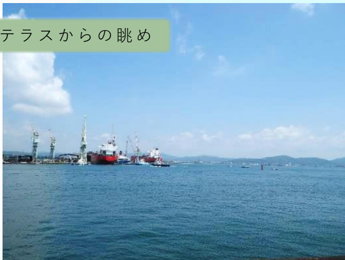
テラスからの眺め